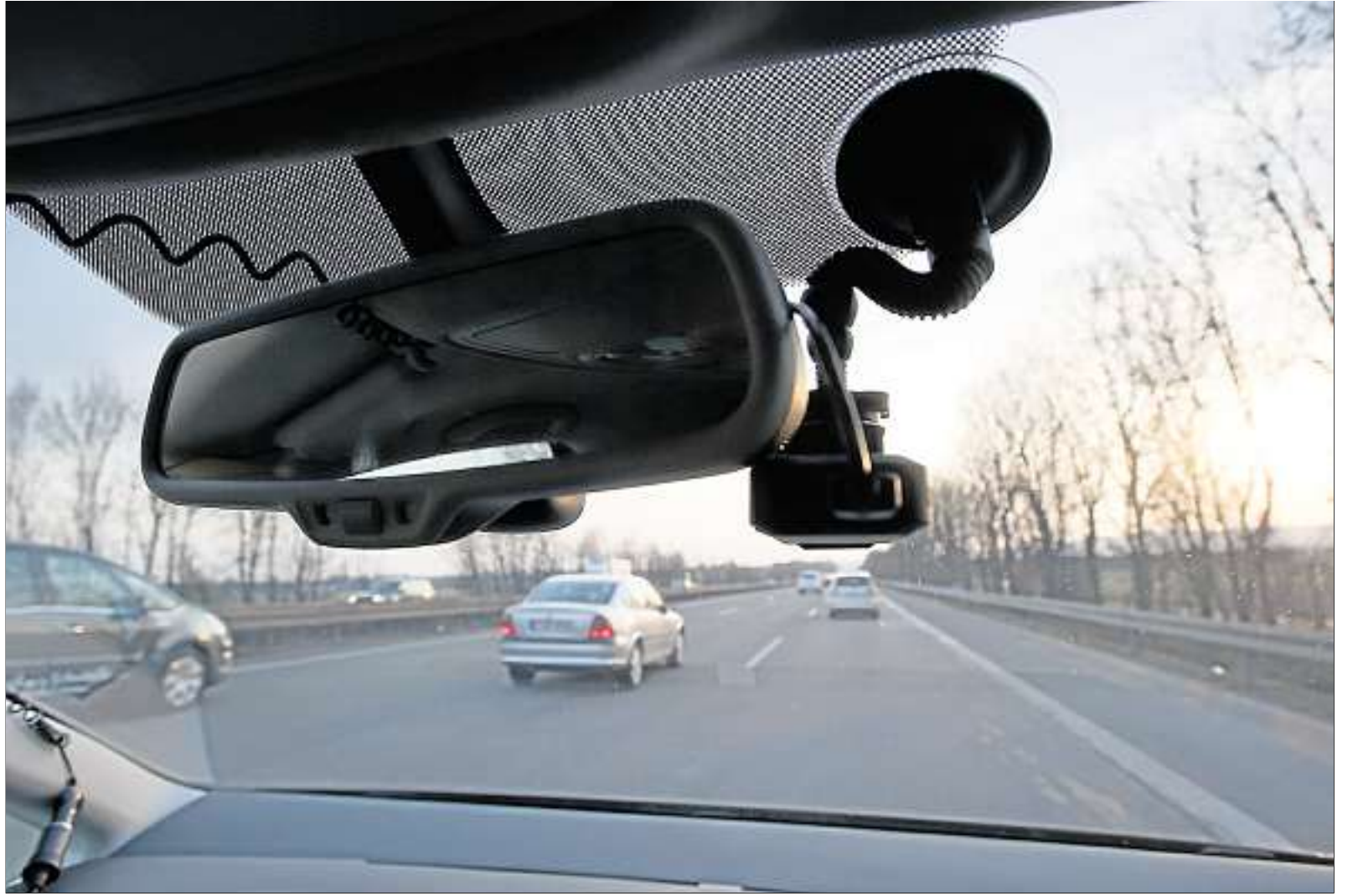
Eine kleine Kamera ist in einem Auto neben dem Rückspiegel installiert, um die Verkehrssituation zu filmen.

Zu glauben, man sei auf der sicheren Seite, nur weil die Kamera mitlaufe, sei also falsch.